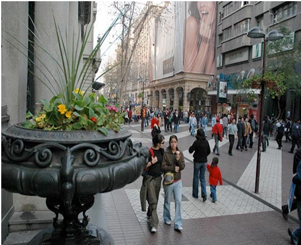
Centro de Santiago, Paseo Ahumada